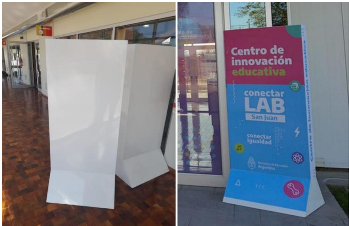
Img.10 Tótems autoportantes