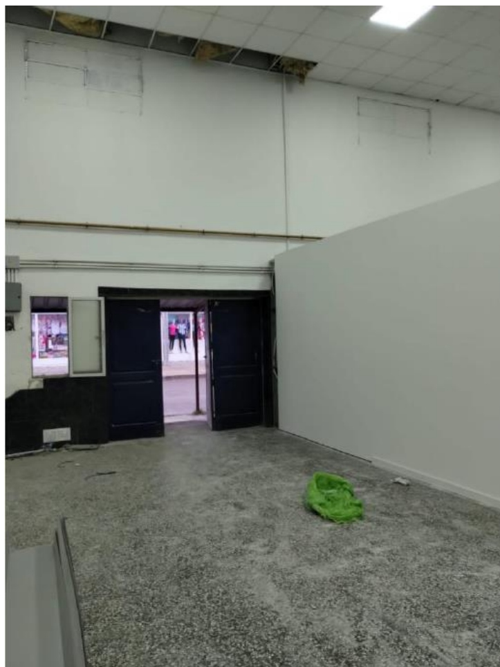
Img.13 Alto tránsito y puerta de ingreso (desde adentro)