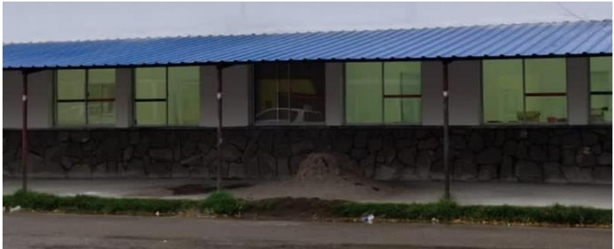
Img.11 Ventana exterior

2023 - 1983/2023 - 40 años de democracia