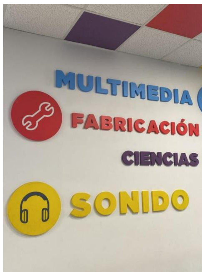
Img. 6 corpóreos paredes