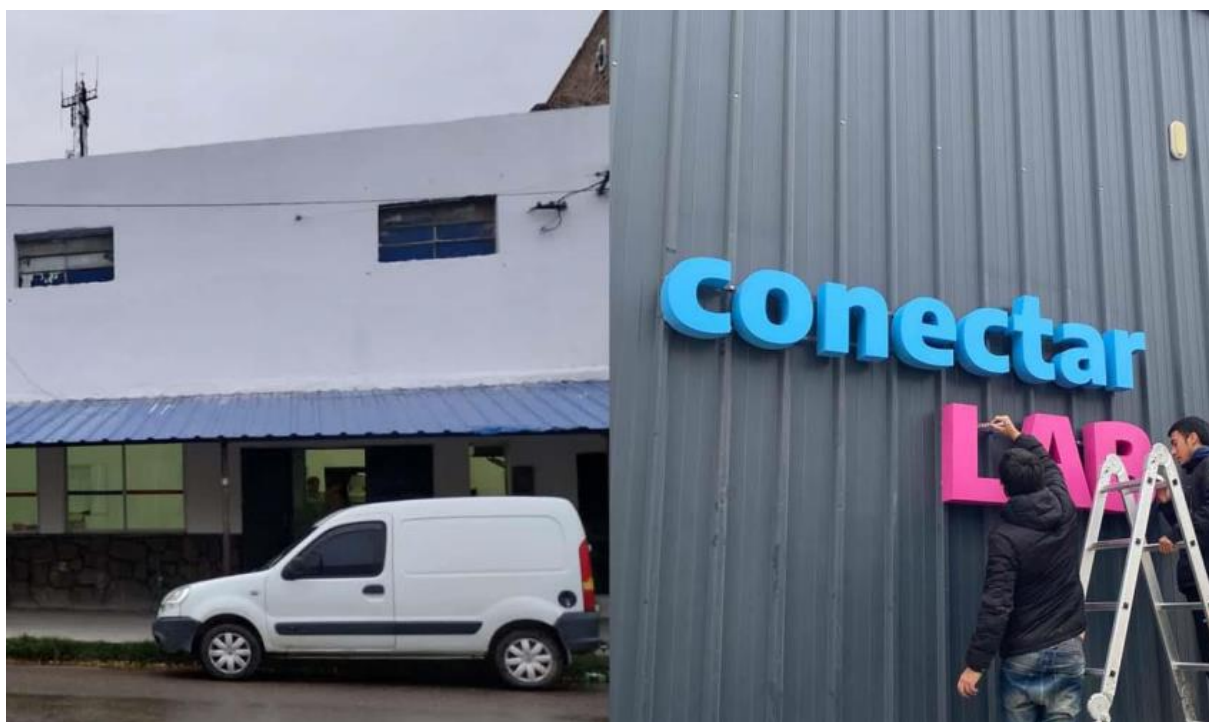
Img.7 Logo corpóreo