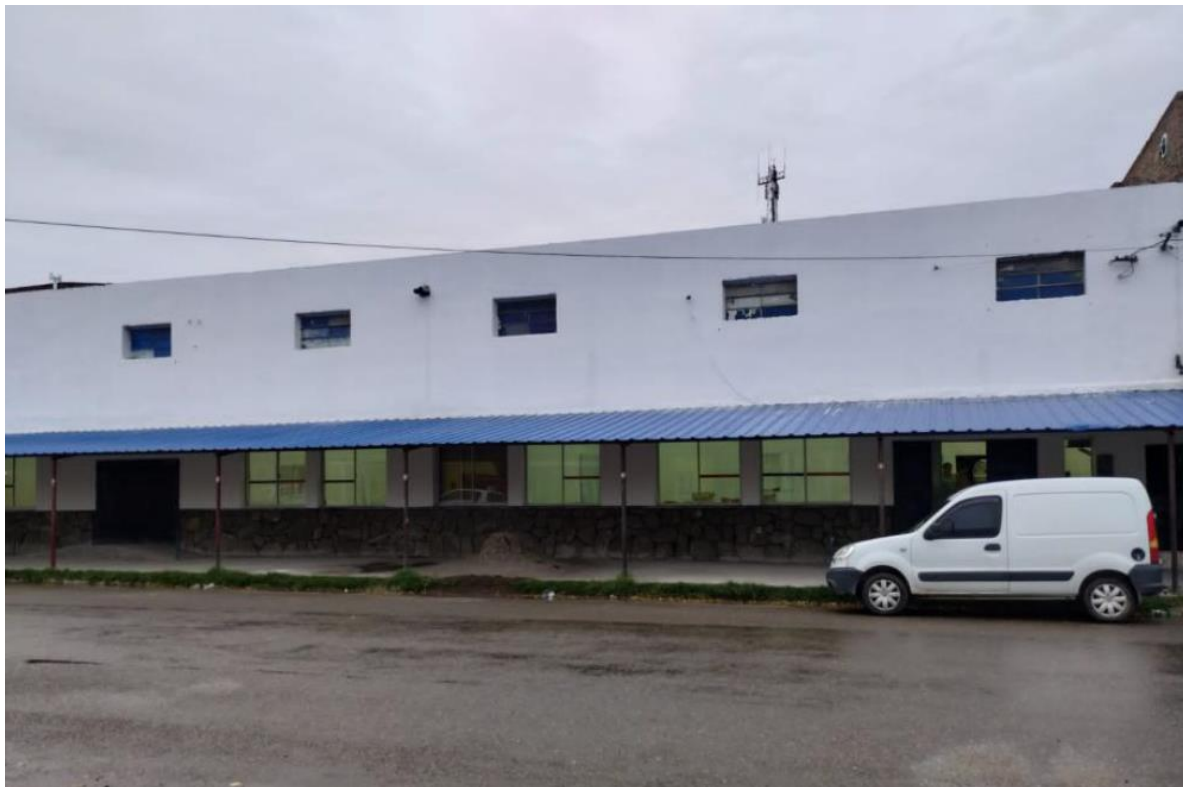
Img.12 Puerta ingreso edificio y fachada