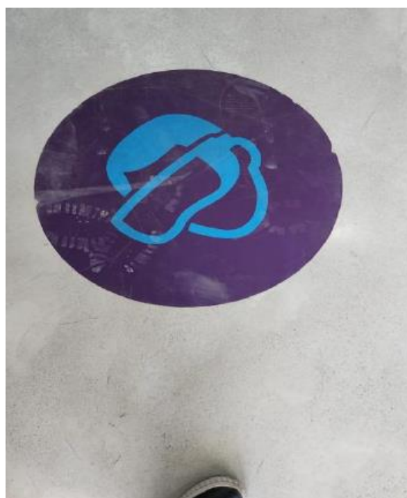
Img.14 Ploteo piso Alto tránsito